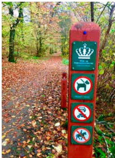
Skilt til offentlig skov.

I private skove må man kun færdes mellem klokken 6.00 og solnedgang, al motorkørsel i skoven er forbudt.