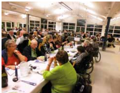
Et billede af de mange tillidsfolk ved middagen lørdag aften. Her ses det nordjyske bord.

Det nok allervigtigste punkt på kongressen var at forretningsudvalget havde fremsat et forslag om strukturændring. Så den øverste myndighed bliver et repræsentantskab. Kort sagt indebærer dette forslag en forenkling af strukturen således at den øverste myndighed mødes hvert år og i et stærkt begrænset antal. Dette vil betyde at kongressen afskaffes til fordel for et årsmøde med et længere interval imellem. Repræsentantskabet skulle vælges hvert 2. år og med alle regioner og specialkredsene repræsenteret. Ændringen skulle give en årlig besparelse på 250.000 kr. Forslaget blev desværre forkastet, idet der ikke blev opnået 2/3 af stemmerne.