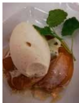
Et lille udpluk af aftenens retter.