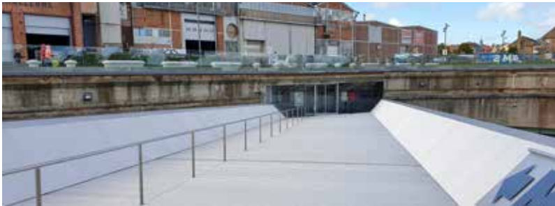
Her ses den tilgængelige indgang til Museet for Søfart