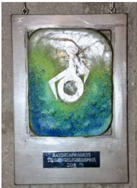
Tilgængelighedspræmie fra 2018.

Efter en masse flotte indtryk af de oplyste miner, er der mulighed for at forsyne sig med mad og drikke i cafeen, ligeledes er der mulighed for at besøge et pænt handicaptoilet.