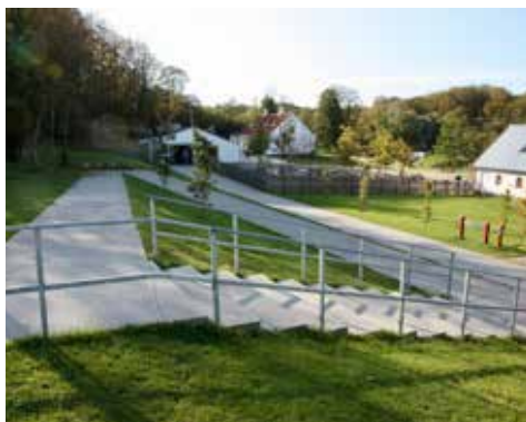
Adgangsforholdene er helt i top.

Det første der slår mig er de gode parkeringsforhold for handicapbiler, dernæst de handicapvenlige adgangsforhold, der gør sig gældende hele kalkminen igennem.