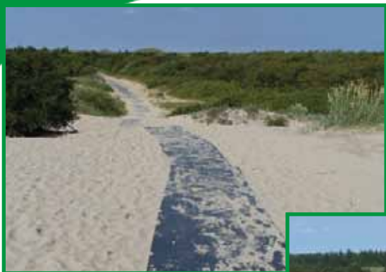
Kørestolsbanen ved Råbjerg Mile