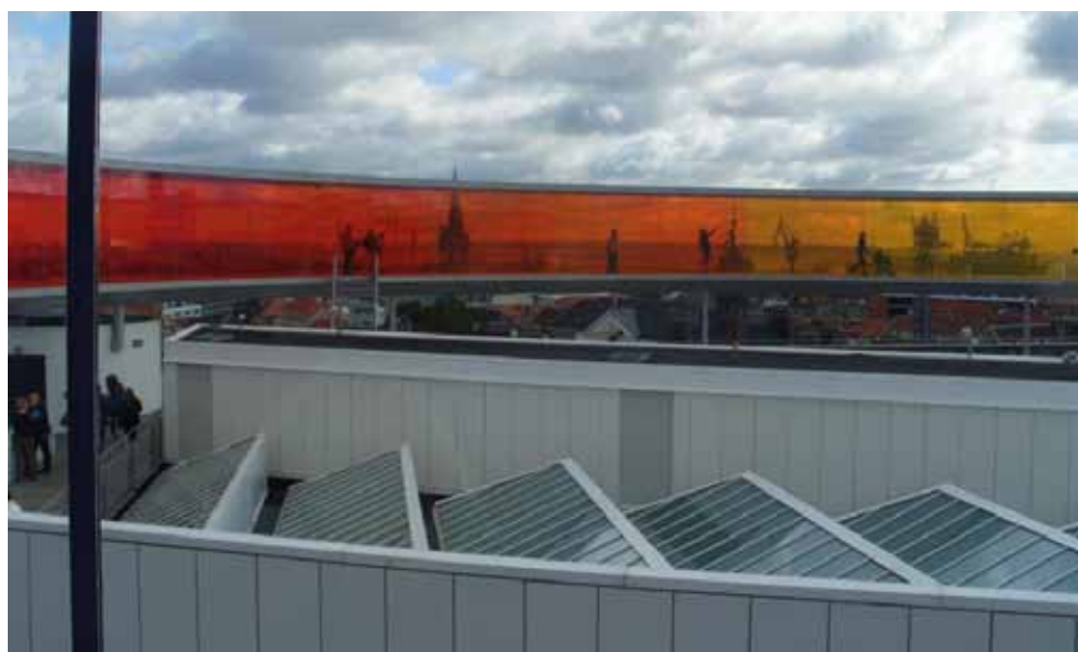
Your rainbow panorama - Olafur Eliasson