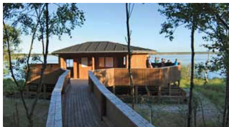
Tofte Sø Tårnet

Lille Vildmose byder på nogle af de allerbedste faciliteter for publikum i den danske natur. Det gør den i kraft af en række observationstårne og gangstier, som den naturbevarende Aage V. Jensen Naturfond har etableret i området.