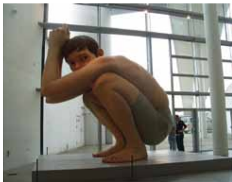
Ron Muecks »Boy«

Gratis billet for ledsager, mod fremvisning af ledsagerkort.