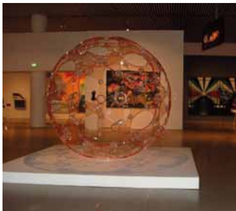
ARoS faste kunstsamling