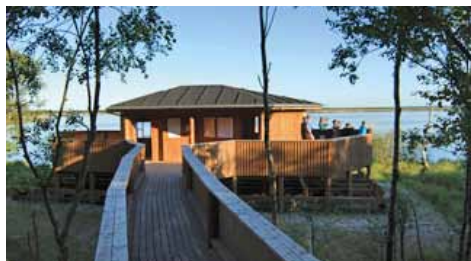
Tofte Sø Tårnet

Lille Vildmose byder på nogle af de allerbedste faciliteter for publikum i den danske natur. Det gør den i kraft af en række observationstårne og gangstier, som den naturbevarende Aage V. Jensen Naturfond har etableret i området.