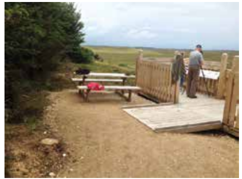
Indgangen til platformen

Naturen skal også kunne opleves fra en kørestol. Platform med udsigt til kronhjorte og traner i nationalparken.