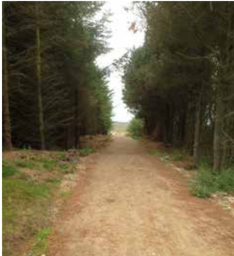
Skovvejen ud til platformen

Den 20. maj 2016 blev, var der indvielse af en platform til kørestolsbrugere i Nationalpark Thy. Sådanne handicapvenlige anlæg breder sig.